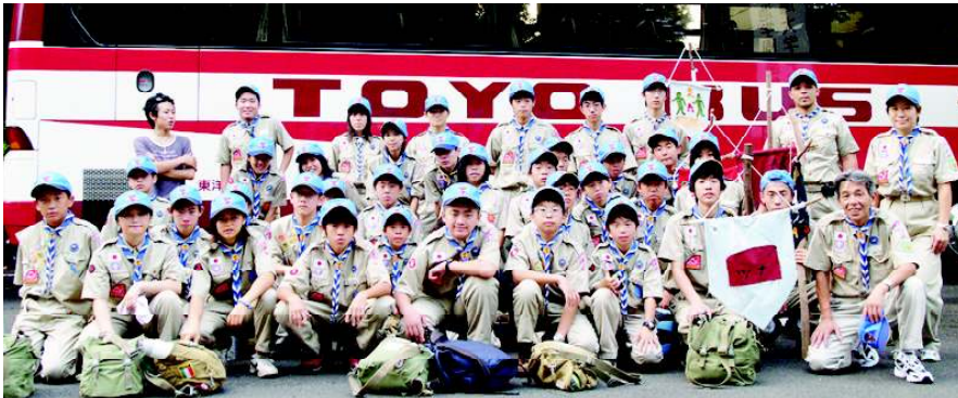
出発時の千葉12隊の写真です。