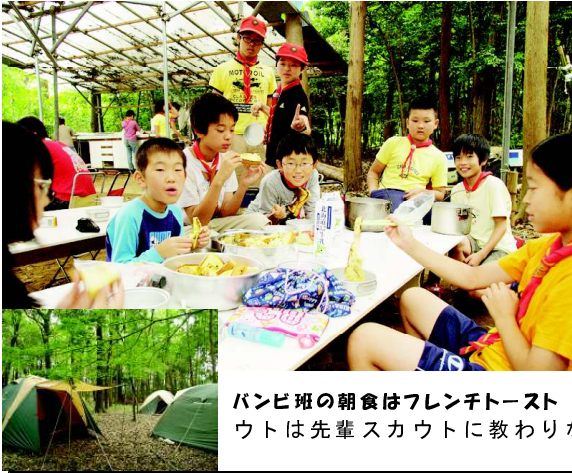
パンビ班の朝食はフレンチトースト