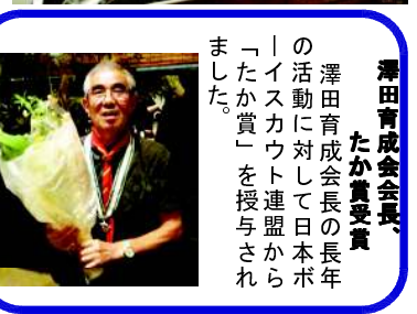
澤田育成会会長、たか賞受賞の活動に対して日本ボーイスカウト連盟から「たか賞」を授与されました。