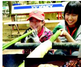
バームクーヘン 大成功

ボーイ隊恒例の春キャンプが野営場でゴールデンウィークの5月2日から5日にかけての4日間、野営場にて行われました。初日はお昼に集合し、テントの設営の後、夕食の準備に入ります。夜はナイトハイク。2日目は初日に設置した家型テントの向きを直します。分かりにくいのですが家型テントの「妻」には前後があるのですが、逆に設置してしまったからです。女子が協力してバームクーヘン、男子は昼食作りです。夕方からは銭湯に寄りながらハイキングを行いました。3日目の夜はキャンプファイヤー。天候にも恵まれ充実した春キャンプでした。