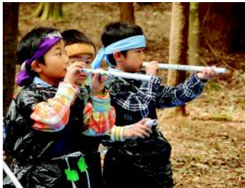
吹き矢の訓練は真剣そのもの

は続きます。目隠ししての味覚修行。中身を見ないで当てる嗅覚修行。そして触っただけで何かを当てる触覚修行を次々にこなします。大変な忍者修行もこなして大満足のビーバースカウト達でした。