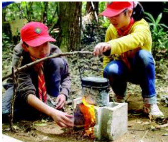
二人組になって飯盒炊さん