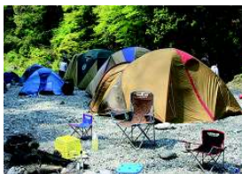
寒川キャンプ場は河川敷