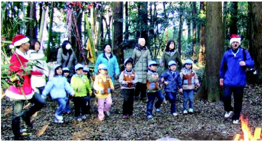
ビーバースタッツ、サンタとトナカイも

2010 2/11 第2号 〈発行〉 日本ボーイスカウト千葉県連盟 柏第7団 〈発行責任者〉 高橋 雅彦 〈編集〉 西尾 多道