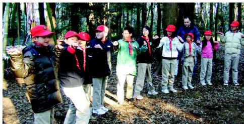
ボーイのコアラは2倍速