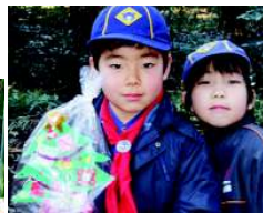
じゃんけん大会勝者