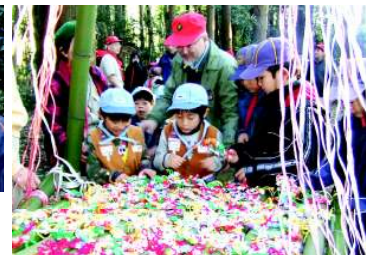
キャンディーリースに歓声