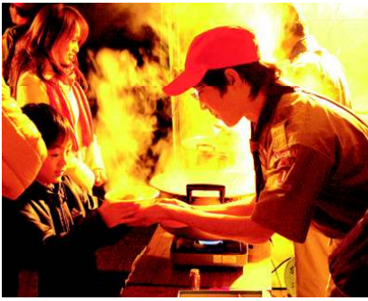
小さい子に「はい、どうぞ。」