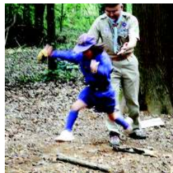
ビーバーからカフへ飛びます

柏第7団も第31期を迎え、9月27日(日)野営場にて上進式、入隊式が行われました。新しく入隊したスカウトはビーバー隊2名、カブスカウト隊5名で、各隊のスカウト数はビーバー隊8名、カブスカウト隊23名、ボーイスカウト隊14名、ベンチャースカウト隊7名、ローバースカウト隊9名の計61名でスタートを切りました。リーダーも新しいメンバーを迎えて、子供達と楽しく充実した活動にみんなでいきましょう。