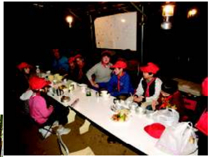
ランツの下で「いただきま〜す」 「最後の晚餐」風の並びです