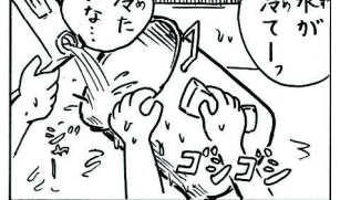
お話はもちろんフィクションです