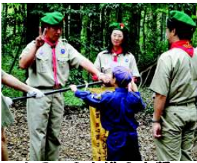
カフへの上進の宣誓

柏第7団も第31期を迎え、9月27日(日)野営場にて上進式、入隊式が行われました。新しく入隊したスカウトはビーバー隊2名、カブスカウト隊5名で、各隊のスカウト数はビーバー隊8名、カブスカウト隊23名、ボーイスカウト隊14名、ベンチャースカウト隊7名、ローバースカウト隊9名の計61名でスタートを切りました。リーダーも新しいメンバーを迎えて、子供達と楽しく充実した活動にみんなでいきましょう。