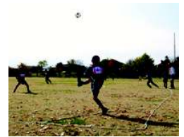
ナイスキック！これは大きい