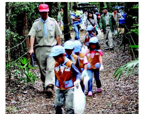
「空き缶はないかな～」 カントリー大作戦中のビーバースカウト

薄曇りの中、入隊上進式の前に大勢の保護者のかたがたと共に「カントリー大作戦」が行われました。「カントリー」とは「郊外」という意味だけでなく、「缶を取る」→「缶取り」だって皆さんご存じでしたか? ビーバーからローバーまでのスカウト全員でお世話になっている野営場の周囲を30分かけて「カントリー」しました。成果は空き缶25本と意外に少ない感じがしますが、この日に限らない日頃の清掃活動の成果が現れてきているのでしょうか。また、ペットボトル飲料が増えて、しかもリサイクル意識が浸透してきて空き缶自体が少なくなってきたのかもしれない。集めた缶やゴミはスカウト達がそれぞれ分担して持ち帰ります。