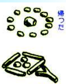
この方向3歩のところに通過あり

自分より後に来るなかに進むべき方向などを伝えます。多くのサインがあります。「カフフックくま」より