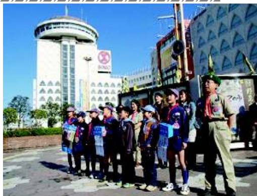
「ありがとうございます」 皆様のご協力に感謝申し上げます。

スカウト達の活動で96,172円の貴重な募金を集める事ができ、ユニセフへお預かりしたお金を振り込むことができました。