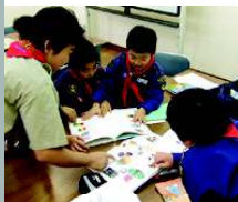
前の活動で自分たちの国を選び国旗を描きました